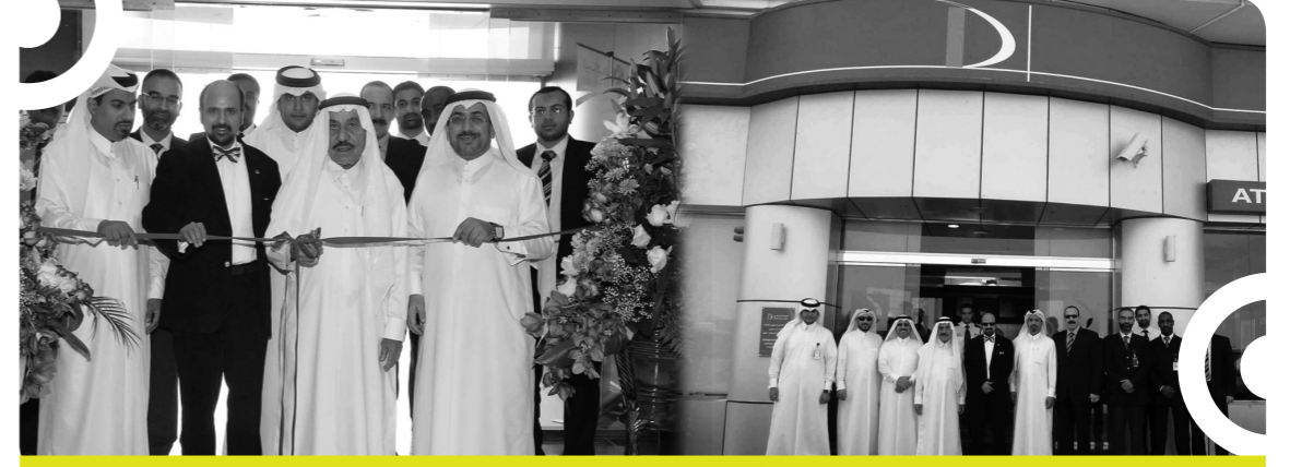
افتتاح فرع الدوحة الإسلامي في الوكرة

وفي هذا الإطار تم إكمال آليات العمل بإدارة المخاطر إلى فريق على درجة عالية من الخبرة والكفاءة. ويتم تنفيذ إطار الرقابة من خلال لجان إدارية مختلفة مثل لجنة الائتمان ولجنة الاستثمار ولجنة المخاطر التشغيلية ولجنة إدارة الموجودات والمطلوبات التي يرأسها الرئيس التنفيذي للبنك. وإلى جانب اللجان الإدارية، تتولى لجنة التدقيق التابعة للمجلس مراجعة التوصيات والنتائج التي توصلت إليها فرق التدقيق الداخلي والخارجي ومفتشو المصرف المركزي.