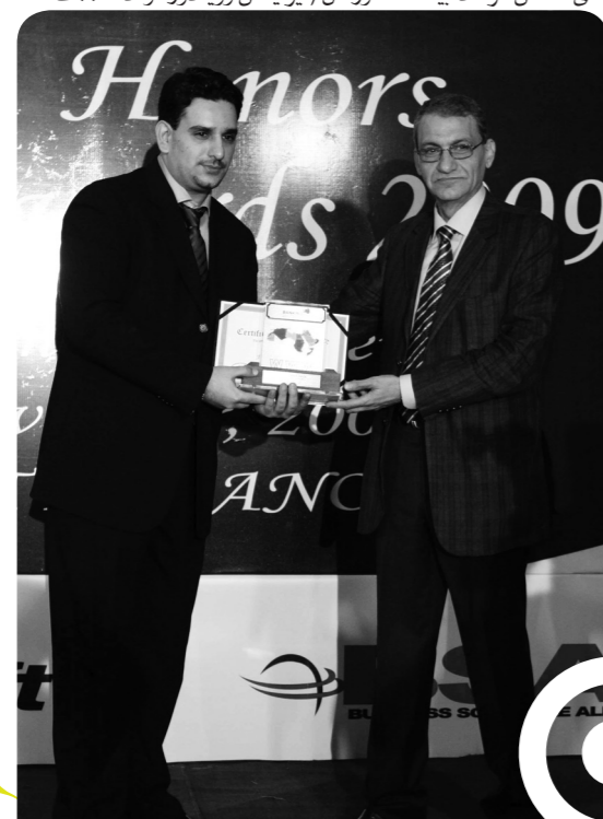
موقع بنك الدوحة الإلكتروني يفوز بالجائزة الأولى في مسابقة جوائز المواقع الإلكترونية المصرفية لعام ٢٠٠٩

وتعتبر تكنولوجيا المعلومات بمثابة العمود الفقري الذي يرتكز عليه البنك في تقديم خدماته بفاعلية. ولهذا تم التركيز على إدخال أفضل أنواع التكنولوجيا والموارد لضمان تقديم أفضل أنواع الخدمات. وتتميز النظم لدى بنك الدوحة بالحدثة من حيث بنيتها الهندسية المتكاملة القائمة على أساس قواعد بيانات الأوراكل / يونيكس وويندوز. وقد صممت تلك