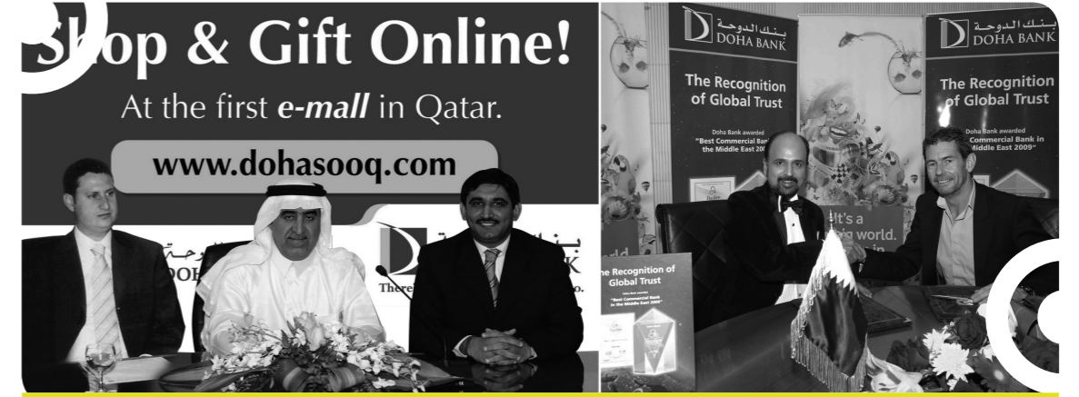
إطلاق سوق الدوحة

انتهج قسم الخدمات المصرفية للشركات منهج التطوير والتنوع في المنتجات لتحقيق نمو انتقائي، وقد ركز على المراقبة الفعالة بهدف ضمان تحسين جودة الأصول. كما استطاع توسيع قاعدة عملائه من خلال إقامة علاقات جديدة مع شركات بارزة على المستويين المحلي والدولي. وقد حقق فرعاً الكويت ودبي نمواً جيداً. هذا بالإضافة إلى تنوع النمو مع التركيز بشكل أساسي على تمويل العقود بما يتماشى مع عجلة النمو الاقتصادي في البلاد. ويواصل القسم أيضاً تركيزه على زيادة حجم الإيرادات من الرسوم والعمولات والبيع الضمني لمنتجات