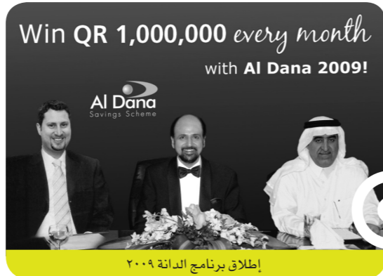
إطلاق برنامج الدانة ٢٠٠٩

وشهدت عمليات بنك الدوحة الفوري - منفذ الخدمات المصرفية الإلكترونية في البنك نجاحاً مستمراً منذ عام ٢٠٠٤، حيث يقدم خدماته للأفراد على مدار الساعة وطوال أيام الأسبوع من خلال قنوات