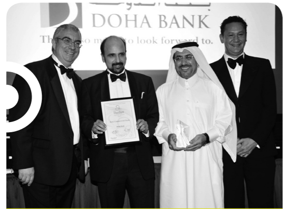
بنك الدوحة يفوز بجائزة أفضل بنك تجاري لعام ٢٠٠٩ من قبل مجلة بانكر ميدال إيست

دول مختارة. حيث أبرم البنك خلال العام اتفاقيات تحالف مع بنك القاهرة في مصر، وبنك مزارعي جوز الهند المتحد في الفلبين، وبنك الائتمان والتجارة النيبالي، وبنك هاتون الوطني في سيريلانكا، وبنك نيجارا الإندونيسي. وتؤهل هذه الاتفاقيات البنك لمساعدة المغتربين في دولة قطر في تلبية احتياجاتهم الخاصة بالحوالات، والتحويل السريع للأموال، بالإضافة إلى احتياجاتهم الاستثمارية.