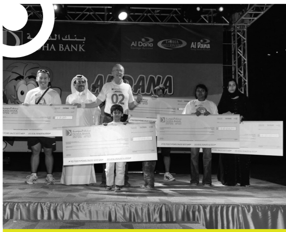
الفائزون في سباق الدانة الأخضر للركض