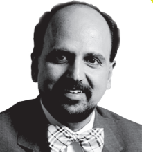
رامافان سيتارامان الرئيس التنفيذي