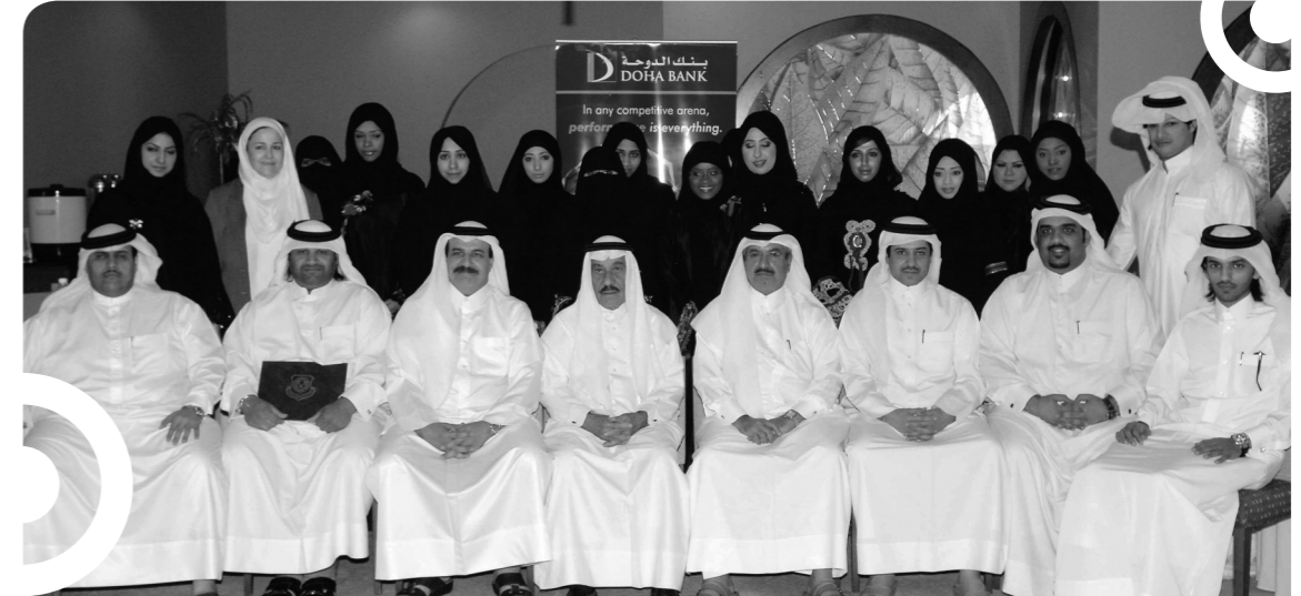
حفل تخرج الموظفين القطريين

المتوقع أن يتم تطبيق هذه الحلول في عام ٢٠١٠ وسوف يكون هذا النظام الأكثر تقدماً في المنطقة. وبطبيعة الحال سوف تعزز هذه المبادرات من مستوى رضى العملاء.