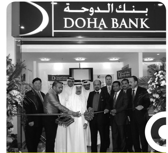
افتتاح فرع اللولو هايبر ماركت

انصب عمل إدارة الخزينة في البنك خلال العام على الاستمرار في عملية التطوير بهدف تعزيز وتنمية الأنشطة الاستثمارية الأخرى. وحيث أننا انتهينا من المرحلة الأولى من تطبيق نظام الربط الإلكتروني فقد أصبحنا في وضع قوي للإسراع في هيكلة عروض منتجاتنا في مجالي الخزينة والاستثمار. وقد قمنا بزيادة عدد الموظفين وركزنا على رفع كفاءتهم ومهاراتهم وبنينا فريقاً متفرغاً للمبيعات. وقد حاز تدريب الموظفين على قسط كبير من هذه الجهود، حيث استخدمنا برامج مكثفة