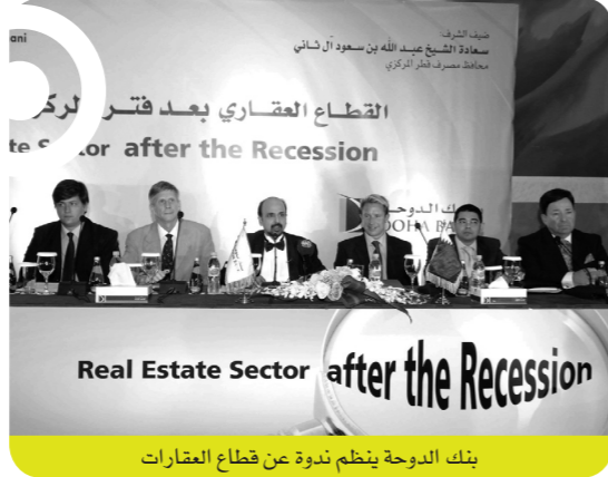
بنك الدوحة ينظم ندوة عن قطاع العقارات

تشأ المخاطر القانونية نتيجة الضعف القانوني الناتج عن الإجراءات القانونية وغياب الأحكام الداعمة في القوانين واللوائح التنظيمية. ولتسليح مثل هذه المخاطر يحتفظ البنك بفريق من المحامين من ذوي الكفاءة والاختصاص بقوانين الشركات والذي تقع على عاتقه مهام المصادقة على كافة الاتفاقيات التي يبرمها البنك مع الأطراف الأخرى ومراجعة المستندات الخاصة بجميع المنتجات والخدمات التي يتم طرحها على العملاء والأطراف المقابلة.