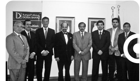
سعادة محافظ مصرف قطر المركزي يزور مكتب

وفيما يتعلق بسياسة البنك الخاصة بتوزيع الأرباح فهي تسعى إلى مكافأة المستثمرين على الثقة التي أولوها للبنك ولكنها في نفس الوقت تراعي