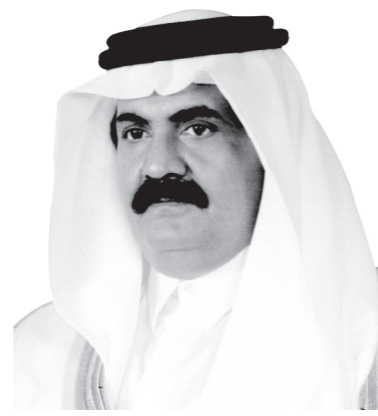
حضرة صاحب السمو الشيخ حمد بن خليفة آل ثاني أمير البلاد المفدى