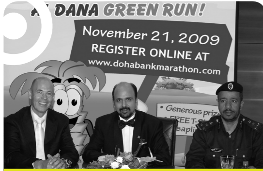
الإعلان عن مسابقة الدانة الخضراء للركض ٢٠٠٩

• ضمان إعادة هيكلة الأعمال وفقاً للإستراتيجيات المعتمدة من خلال إجراء تحسينات في الكفاءة التشغيلية لدى الدوائر الرئيسية في البنك