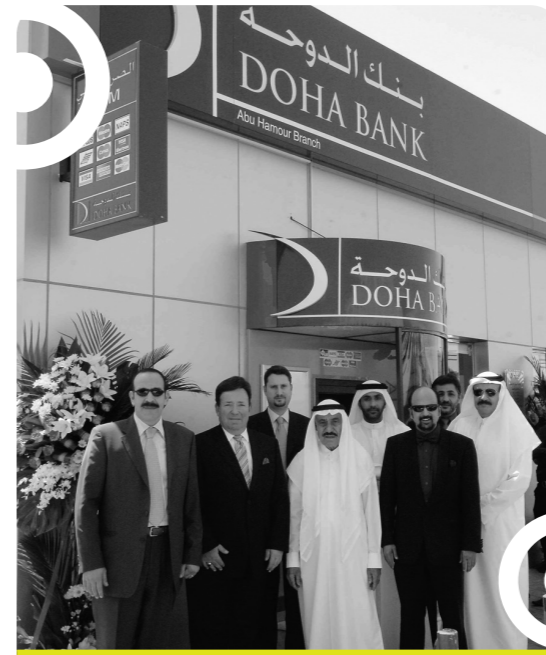
افتتاح فرع أبو هامور

وواصل برنامج الدانة للتوفير نجاحاته المتعاقبة على مدار الست سنوات السابقة، حيث أصبح الآن علامة مميزة للبنك في دولة قطر. وعكف البرنامج على تقديم جائزة نقدية كل شهر بقيمة مليون ريال قطري