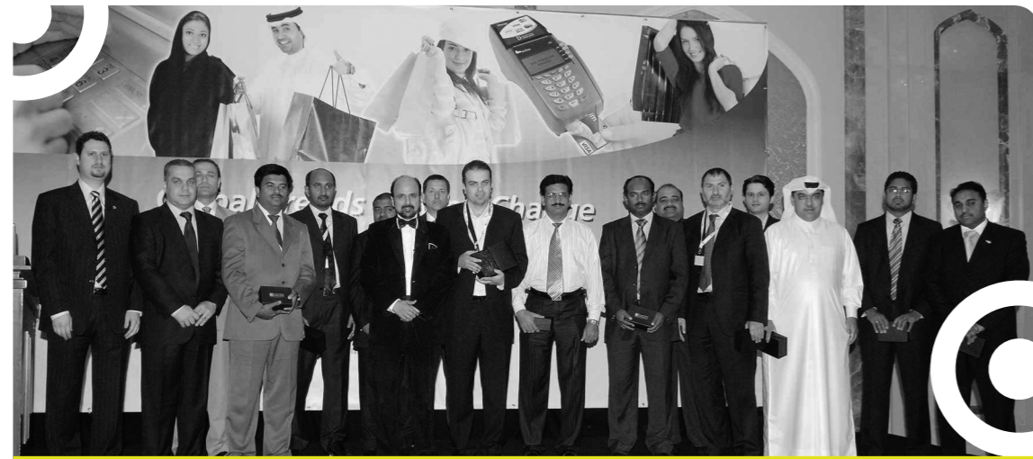
بنك الدوحة ينظم ندوة عن التوجهات العالمية وتأثيرها على أسواق الدفع في منطقة الشرق الأوسط

ومن ناحية أخرى، بدأ البنك مرحلة جديدة يهدف فيها إلى إعادة تعريف مهام دائرة الخدمات المصرفية للأفراد لمواصلة الأداء المشرف الذي قدمته على مدار الست سنوات الماضية، ولتعزيز حضور البنك في السوق في المستقبل من خلال مشروع شامل ومتكامل برعاية وإشراف سعادة رئيس مجلس الإدارة. وكان الهدف الرئيسي من هذا المشروع هو رسم خطة عمل متكاملة للتحويل المصرفي مرتبطة بجدول زمني للتنفيذ بحيث يشعر العملاء من خلاله أن البنك قد دخل في مرحلة جديدة تركز فعلاً على خدمة العملاء والاحتفاظ بهم وكسب ولائهم وتعزيز صورة البنك لديهم.