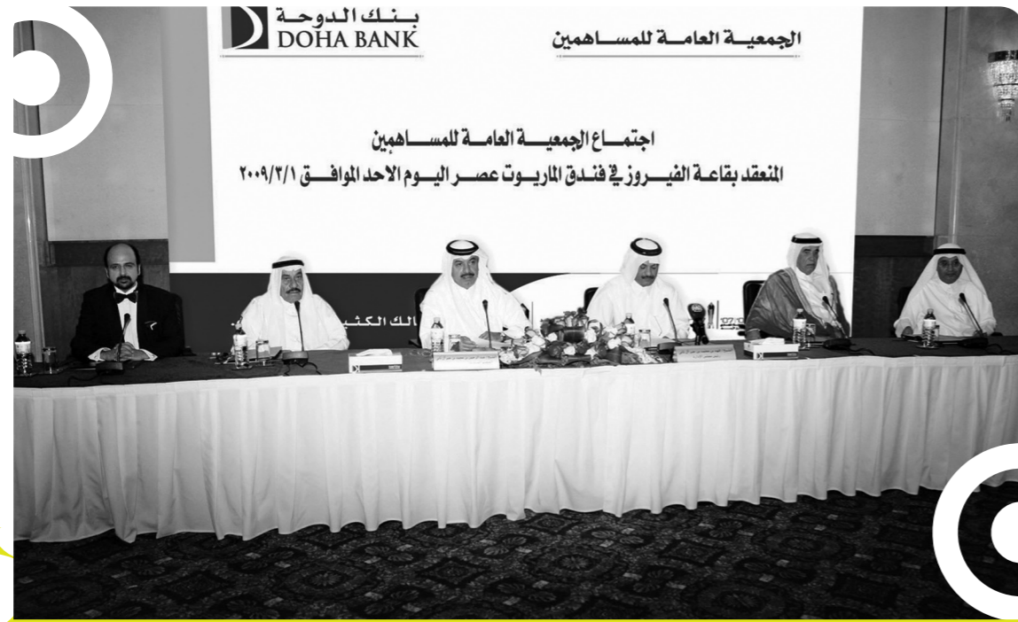
اجتماع الجمعية العمومية

ويتبع البنك معايير التقارير المالية الدولية IFRS في إعداد الحسابات والبيانات المالية. وتماشياً مع مسؤوليات مجالس الإدارات حول العالم، فقد طبق مجلس إدارة بنك الدوحة مجموعة متكاملة من السياسات وذلك وفقاً لمتطلبات الجهات الرقابية في دولة قطر.