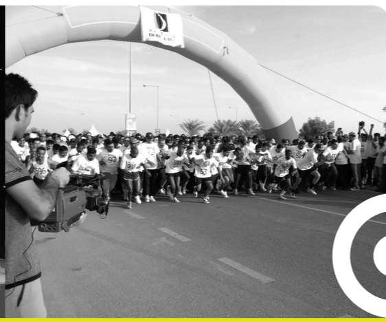
سباق الدانة الأخضر