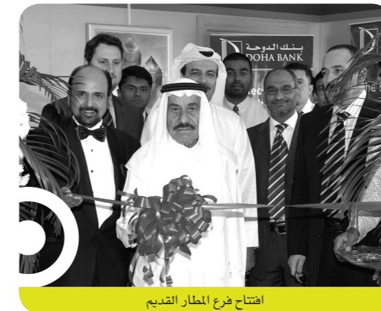
افتتاح فرع المطار القديم