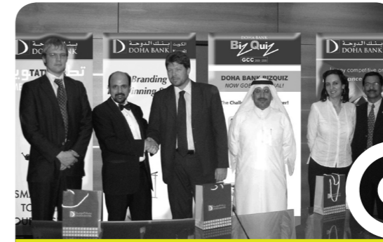
نحو بيئة خضراء مع اليونيسكو وبنك الدوحة

واستمر بنك الدوحة خلال العام في ابتكار المزيد من المنتجات والعروض الترويجية بدءاً من الحملة الناجحة التي أطلقت تحت اسم «تسوق واربح» حيث يحوز العميل من خلال هذا المنتج على ألف نقطة من نقاط الولاء الخاصة ببطاقة دريم عند وصول قيمة مشترياته في المرة الواحدة إلى ألف ريال قطري، إضافة إلى «السقف الائتماني الإضافي». كما أطلق عرض «سافر واربح» والذي من خلاله يحصل العميل على فرصة الفوز بقيمة تذكرة سفره القادم عند استخدام بطاقته الائتمانية خلال