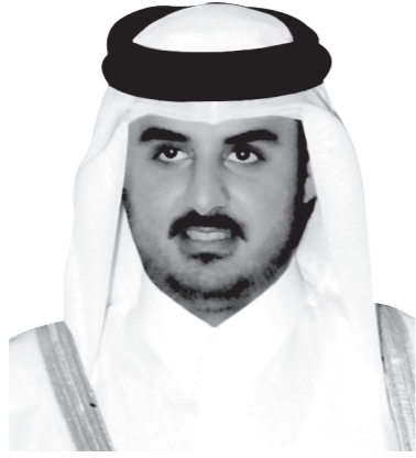
سمو الشيخ تميم بن حمد بن خليفة آل ثاني ولي العهد الأمين