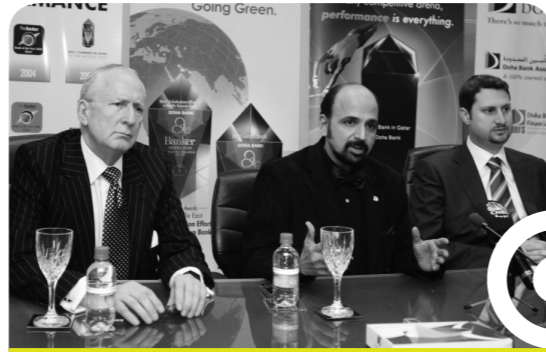
مؤتمر صحفي لتدشين الحساب الأخضر

يشارك بنك الدوحة بشكل فعال في دعم القضايا الإنسانية ونشر الوعي الاجتماعي وتشجيع الفن والثقافة. كما ويقدم أيضاً مساعدات سخية