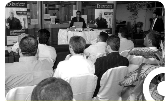
بنك الدوحة يعقد لقاءً تفاعلياً مع عملاء المشاريع الصغيرة والمتوسطة

واصلت دائرة الخدمات المصرفية للأفراد نموها وأداءها القويين في عام ٢٠٠٩، كما استمرت في الابتكار والتجديد وتطبيق أحدث التقنيات لضمان راحة العملاء والسعي نحو التميز في مجال خدمة العملاء. فالمنتجات والعروض والحملات الترويجية واتفاقيات التعاون وأنشطة البنك الواسعة الأخرى قد لبت احتياجات مختلف الشرائح في دولة قطر، وساهمت في تقوية مركزنا التنافسي في مجال الخدمات المصرفية للأفراد. وكان مبدأنا دائماً هو تقديم المنتجات والخدمات التي تركز على احتياجات العملاء، وقد ساعدنا ذلك في تعزيز موقعنا الريادي في السوق في مجال الخدمات المصرفية للأفراد.