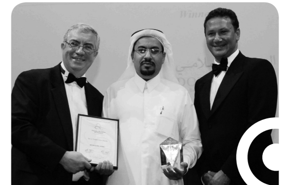
الدوحة الإسلامي يفوز بجائزة أفضل بنك إسلامي محلي في الشرق الأوسط لعام ٢٠٠٩ من قبل مجلة بانكر ميدل إيست

كما ويوفر الدوحة الإسلامي أيضاً ما يفوق الثلاثة عشر منتجاً إسلامياً كالمراجحة والمضاربة والإجارة والاستصناع وغيرها من المنتجات التي تغطي جميع الاحتياجات التمويلية للعملاء من الأفراد والشركات. ويذكر أن الدوحة الإسلامي قد تميز بتقديم برنامج بطاقة الائتمان «إثمار» وبرنامج المدخرين الصغار.