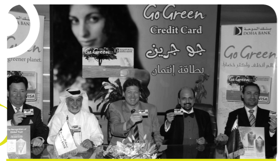
تدشين البطاقة الائتمانية الخضراء من بنك الدوحة